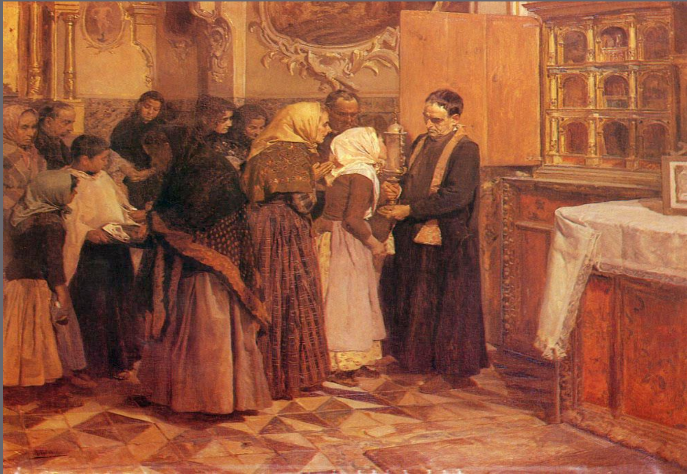
El beso de la reliquia , Joaquín Sorolla.